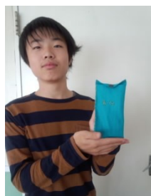
フェルトを使ってペンケースを作りました。 玉結びが難しかったです