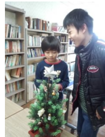
教室にクリスマスツリー を飾りました