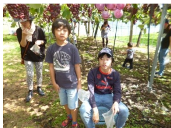
秋のぶどう狩り・・・ お腹いっぱい食べました。